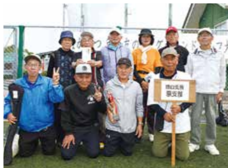
▲団体優勝の原支部

当日は、各支部の代表29チーム、268人が参加し、個人の部と団体の部で熱いプレーが繰り広げられました。