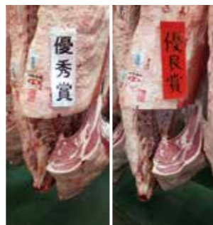
▲左が優秀賞を獲得された(株)山口畜産 右が優良賞を獲得された(株)佐賀牛宮崎牧場