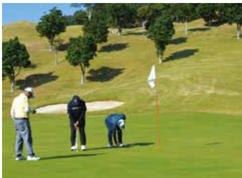
▲ゴルフを楽しむ参加者