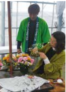
▲フラワーアレンジメント体験をする参加者ら

佐賀県花づくり推進協議会は11月17日、当J A 直売所の唐津うまかもん市場で「さがフラワーフェスティバル」を開きました。唐津市では3年ぶりの開催となり、今年は「いい夫婦の日」に花を贈ろう」をテーマに県産花きのPRが行われ、イベントでは、ヒマワリやカーネーション等の県産花きを使用したフラワーアレンジメント体験会(先着60人)がありました。