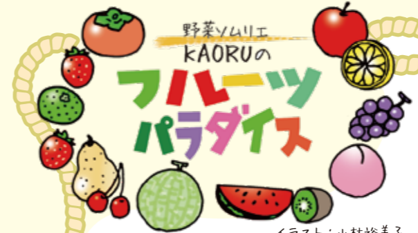
イラスト：小林裕美子

(5) 植え付け 果菜類は晩霜の恐れのない時期(平均気温16、17度以上を目安に)、逆算して播種(はしゅ)日を決めます(表2)。