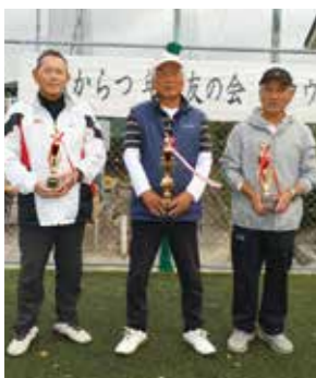
▲個人の部の入賞者