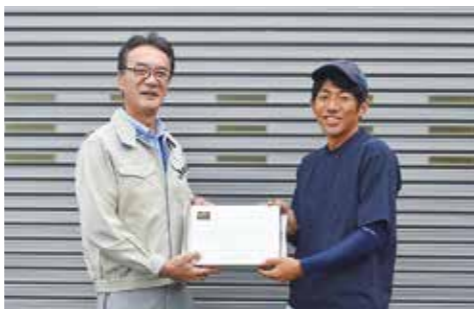
▲当選者への配布の様子